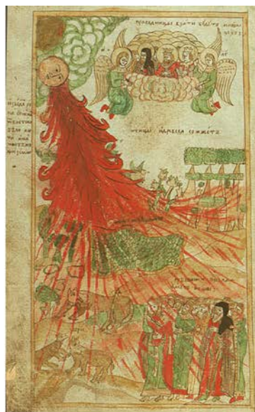
Ил. 6. Явление огненной реки, сжигающей все живое. ГПНТБ СО РАН. Тих.17. Л. 5об.