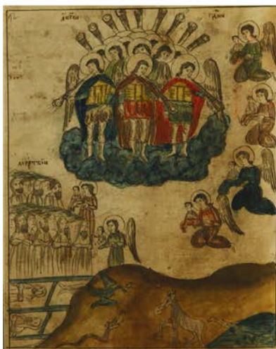
Ил. 3. Ангельские трубы и вставание мертвых. ЛАИ УрФУ. XXVI.14р. Л. 10 об.