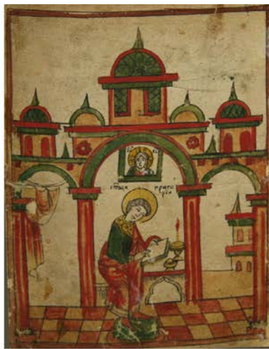
Ил. 2. Пишущий инок Григорий. ЛАИ УрФУ. IV.23р. Л. 96