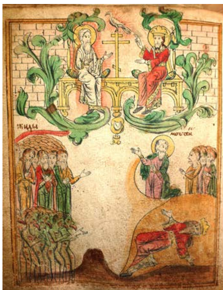
Ил. 5. Святая Троица и Моисей, обращающийся к иудеям. ЛАИ УрФУ. V.77р. Л. 146 об.