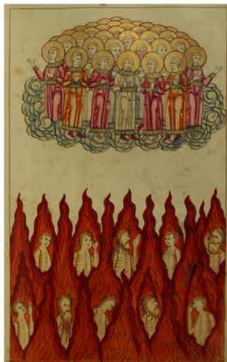
Ил. 8. Видение рая и адского пламени. МНИ. 2.5. Л. 9