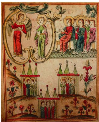
Ил. 4. Ангел, вознесший инока Григория на «высокую гору». ЛАИ УрФУ. V.77р. Л. 77 об.