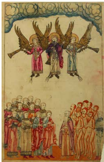
Ил. 7. Трубящие ангелы возвещают о Суде. МНИ. 2.5. Л. 16