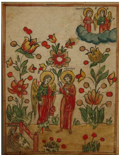
Ил. 1. Ангел и инок Григорий. ЛАИ УрФУ. IV.23р. Л. 40 об.

– «ин мир странен и дивен» (Сборник 3, V.77р, 78); мира на небесах – Господа Саваофа в окружении ангельского чина, херувимов и «всевидащего ока» над ним; изображение града небесного Иерусалима. Содержание раздела сочинения, раскрывающееся в списке V.77р тремя изображениями, в северорусской редакции представлено только одной миниатюрой – условным изображением града небесного Иерусалима.