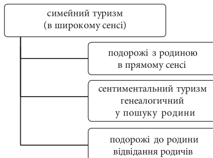
Рис. 2. Поділ сімейного туризму

Українські автори Д. Басюк (2005) і О. Вуйцик (2009) виокремили в ностальгічному туризмі такі види подорожей: 1) подорожі для зустрічі з родичами; 2) відвідання місць, з якими пов'язані важливі події в приватному житті; 3) відвідання місць, з якими пов'язана історія етнічної групи, до якої належить особа або до місць пов'язаних з важливими подіями з життя родини та предків. Сентиментальний туризм, генеалогічний туризм і туризм пошуку родини, як елемент сімейного туризму в широкому сенсі, представлені в типології J. Kowalczyk-Anioł oraz B. Włodarczyk (2011).