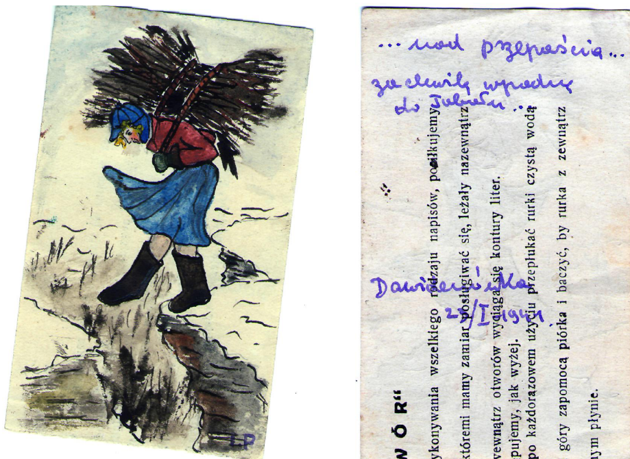
Рис. 6. над przepaścią ... za chwilę wpadnę do Tulewu ... Dawidenówka. 23.I.1941. (над пропастью ... через минутку я зайду (забегу) ... Давыдовка. 23.I.1941) (Arhivnoe 1942)

Проблемы с топливом (чем растопить казан, обогреть своё жилище, дровами или просто вязанкой хвороста) были в любое время года. И летом, и осенью 1940 г., и в жару под 30 градусов, и при морозах «до 25 градусов» в Урицком районе (видимо, так же, как и у автора рисунков из Пешковского района) обстоятельства складывались так, что в посёлке Весёлый Подол отсутствие и добывание топлива становилось для поляков первостепенной задачей: