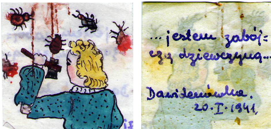
Рис. 4. Jestem zabójcą dziewczyną... Dawidenówka. 20.I.1941 (Я – убийственная девушка... Давыдовка, 20.I.1941) (Arhivnoe 1942)

Следующий рисунок 20 января 1941 г. демонстрирует не только присущий автору художественный дар, но и изрядное чувство юмора. Неизвестная полька в ярких тонах, причём в цвете, изобразила самые обычные сцены жизни депортированных поляков. Борьба с вездесущими тараканами, да ещё и с топором в руках (она в шутку назвала себя «Я – убийственная девушка» (рис. 4) с двойным смыслом), выглядела явной сатирой в отношении антисанитарных условий пребывания в условиях ссылки. Конечно, это была суцная правда, которую автор воспринимала вполне обыденно. Обращает на себя внимание, что на обратной стороне рисунка с имеющейся там надписью одновременно просвечивается образ самой художницы. Это было связано с явно не пригодной для живописи бумагой. В следующем письме она пишет об этой проблеме.