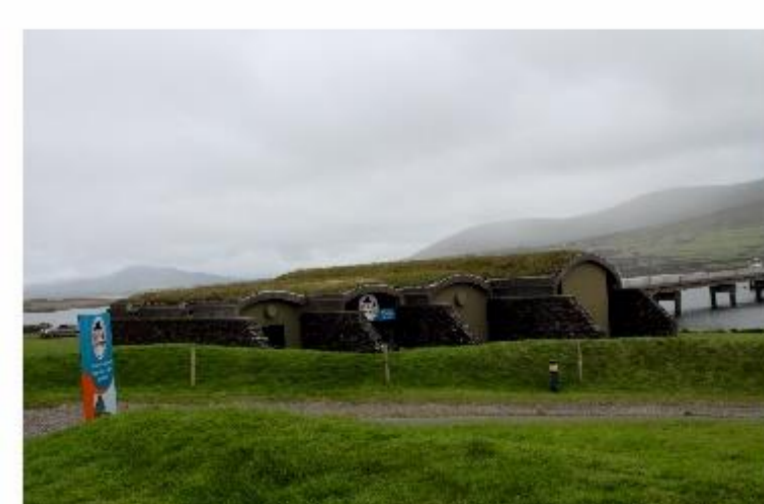
Fot. 19. Visitor Centre w Portmagee, miejscowości, z której wypływają łodzie zabierające turystów na wyspę.

Skellig Michael to skalista wyspa położona na Oceanie Atlantyckim w hrabstwie Kerry o powierzchni 0,226 km 2 . W 1996 roku wyspę wpisano na listę UNESCO ze względu na znajdujący się na niej średniowieczny klasztor założony prawdopodobnie w VII wieku. Maksymalna dzienna liczba odwiedzających została ograniczona przez Office of Public Works do 180 osób ze względu na zniszczenia, jakie były przez nich powodowane. Stan morza i warunki pogodowe sprawiają, że odwiedzanie wyspy możliwe jest jedynie podczas sezonu letniego.