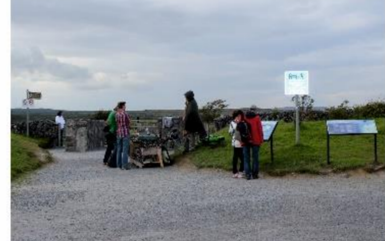
Fot. 13-14. Poulnabrone Portal Tomb zlokalizowany na płaskowyżu Burren (County Clare) i pochodzi z okresu neolitu (4200-2900 r. p.n.e.). W sąsiedztwie obiektu poprowadzono ścieżkę edukacyjną z kilkoma tabliczkami informacyjnymi. Przy parkingu znajdują się tymczasowe kramy z pamiątkami.