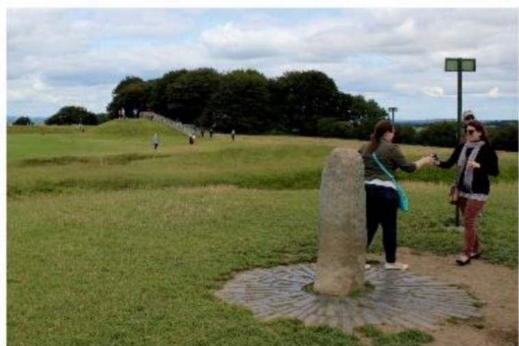
Fot. 3-4. Hill of Tara to wzgórze w hrabstwie Meath, tradycyjne centrum religijne i polityczne wyspy, siedziba arcykrólów z dynastii O'Neil. Zielone wznesienie, otoczone nasypami ziemnymi, zajmuje ważne miejsce w historii wyspy, odkąd w epoce kamienia (ok. 3000-2500 p.n.e.) zbudowano tu grobowiec korytarzowy.