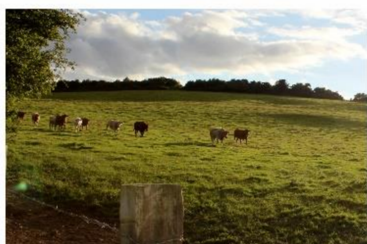
Fot. 5-6. Obszar Knockaulin Hill Fort jest aktualnie wykorzystywany jako pastwisko i dostęp do miejsca jest utrudniony, lecz możliwy (własność prywatna). Miejsce mimo dużej wartości historycznej i stosunkowo dobrego przyhabdania nie zostało do tej pory należycie wyeksponowane.