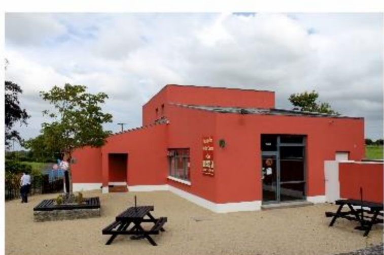
Fot. 7-8. Rathcroghan Visitor Centre znajduje się w średniowiecznej wiosce Tulsk (hrabstwo Roscommon) nieopodal kompleksu nieprzebadanych jeszcze w pełni stanowisk archeologicznych. Znajdują się one na terenach użytkowanych rolniczo i oznaczone są niewielkimi tabliczkami informacyjnymi (trudne do znalezienia).