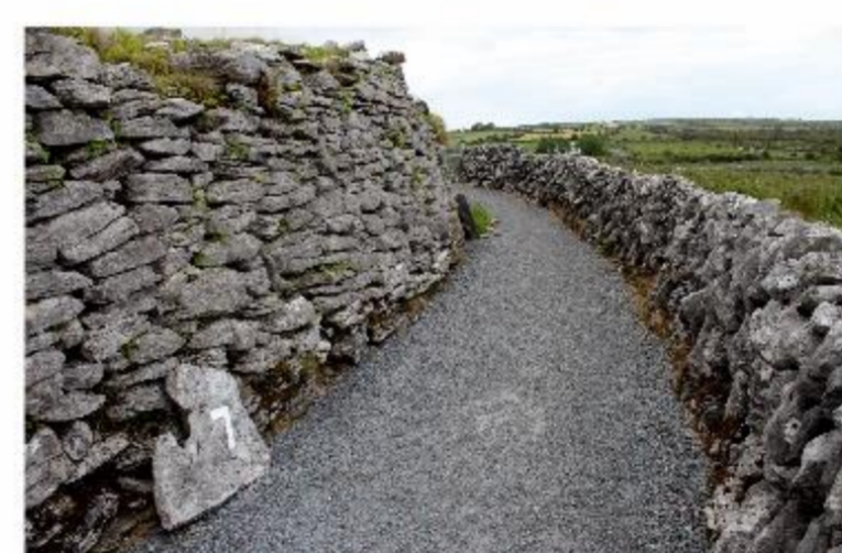
Fot. 15-16. Cahercommaun Stone Fort to potrojna kamienna fortyfikacja w południowo-wschodnim Burren datowana na około 800 r. Przy obiekcie powstał Visitor Centre z niewielkim sklepem z pamiątkami. W ramach atrakcji turystycznej organizowane są pokazy tresury psów pasterskich.