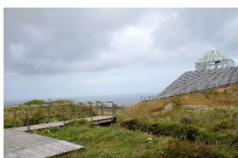
Fot. 9-10. Céide Fields to stanowisko archeologiczne usytuowane na północny County Mayo. Jest to najstarszy znany system pól uprawnych na świecie sprzed około pięciu i pół tysiąca lat. Przez pola poprowadzono system drewnianych kładek spacerowych, nieopodal powstało Visitor Centre.