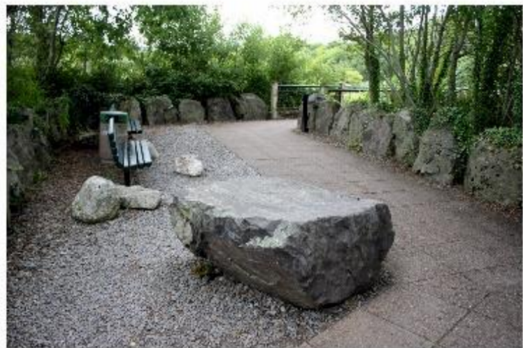
Fot. 1-2. Elementy zagospodarowania turystycznego są umiejętnie wpisane w krajobraz. Skorzystano z lokalnych, naturalnych materiałów. Dominuje impregnowane drewno (poręcze, halustrady) oraz kamienie wykorzystywane jako obchody, ławy i siedziska.