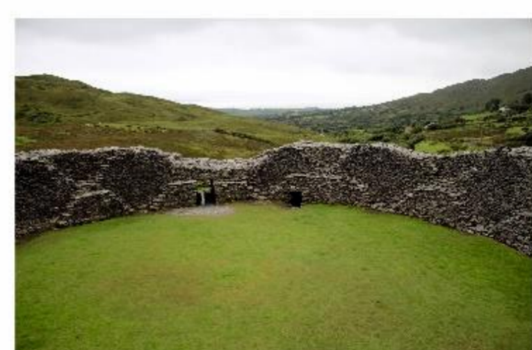
Fot. 17-18. Staigue Fort to częściowo zniszczony kamienny fort z późnej epoki żelaza (300-400 r.) - twierdza lokalnego władcy - położona nieopodal miejscowości Sneem w hrabstwie Kerry. Jedynym elementem zagospodarowania turystycznego są tablice informacyjne.