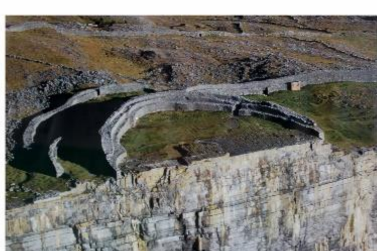
Fot. 11. Zdjęcie lotnicze przedstawiające aktualny stan fortu. Z Visitor Centre prowadzi tu gruntowa droga, poza nią niewiele jest elementów związanych z zagospodarowaniem turystycznym.

Dún Aengus to pozostałość kamiennej budowli obronnej (fortu) pochodzącej najprawdopodobniej z epoki późnego brązu (ok. 700 lat p.n.e.). Tworzą ją trzy koncentryczne, kamienne mury w kształcie półkregów, z których wewnętrzny – największy ma 5,8 wysokości i 4,9 metrów grubości i otacza obszar o powierzchni 5 hektarów. Prawdopodobnie w przeszłości budowla miała kształt regularnego koła, jednak prawie jej połowa osunęła w wyniku podmycia klifu, na skraju którego się znajduje.