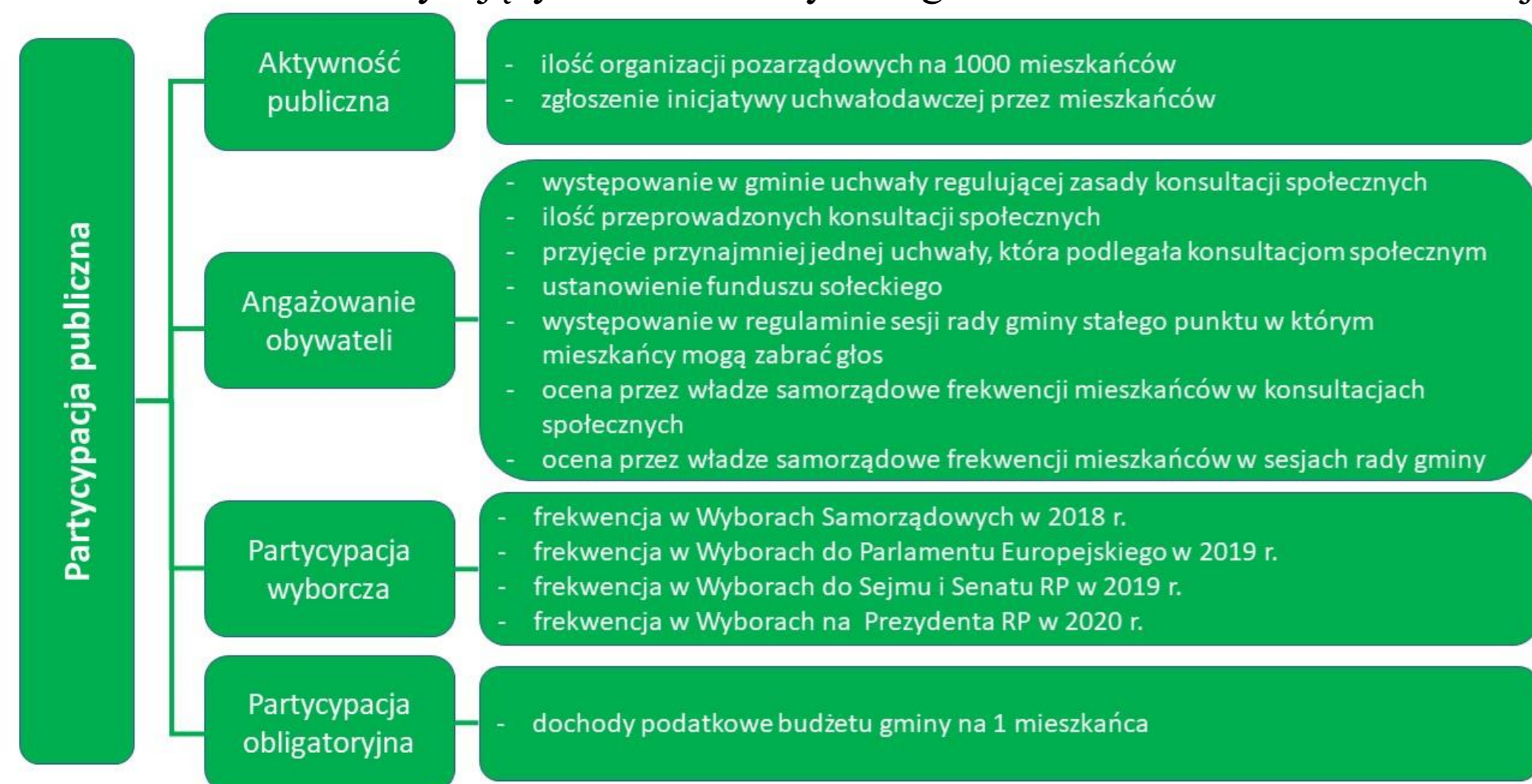
Rys. 1. Struktura partycypacji publicznej

Celem badań była ocena poziomu funkcjonowania partycypacji publicznej w gminach wiejskich województwa warmińsko-mazurskiego. Materiał badawczy stanowiły dane pozyskane z baz Polskiej Komisji Wyborczej, Banku Danych Lokalnych GUS oraz badań ankietowych przeprowadzonych wśród przedstawicieli władz samorządowych gmin wiejskich województwa warmińsko-mazurskiego (badania finansowane przez Narodowe Centrum Nauki (nr 2019/03/X/HS4/01255)). W ramach badań wyodrębniono 14 wskaźników charakteryzujących różne formy zaangażowania mieszkańców w funkcjonowanie gminy w ramach 4 kategorii (rys. 1).