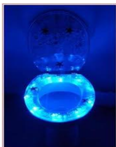
Odlot w Kosmos