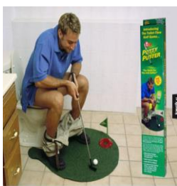
Przyjemne z pożytecznym....