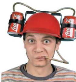
Dla spragnionego kibica