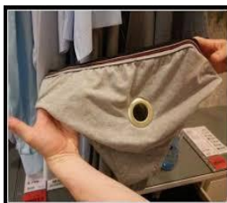
Teraz można już ‘bąki’ puszczać .....